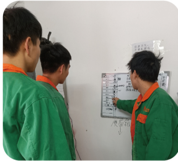
特殊时期布置工作计划