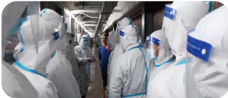
与会人员分批参观学习安徽大区星甸猪场

成功的事情都是谋划出来的！相信在充分尊重生物安全科学常识的基础上想问题、做事情，通过持续深入开展“双改”和自育肥转型工作，进一步优化资源配置、提升自育肥效率，我们一定能够战胜非瘟疫情，战胜猪周期低谷，缔造卓越成本竞争力！