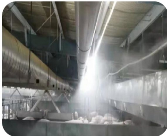
改造后的喷淋系统

上一批次猪群,由于没有使用喷淋系统,猪只在栏内热的烦躁,来回踩踏粪便,造成栏内卫生变差,且粉尘含量大增,猪只咳嗽现象明显,直接影响猪只生长,饲料转化率较差。喷淋系统使用以后,不仅解决了以上问题,猪只真正做到了肯吃、肯长、肯睡;而且栏位内的有害气体也融进了雾化中,减少了舍内异味。