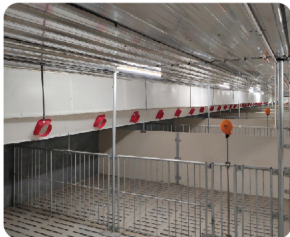
改造后的精准通风

决猪舍各个角落环境均匀性、温度稳定性。均匀性就是不能有死角,确保每一头猪都有足够的新鲜空气,确保猪舍每个角落氨气、二氧化碳不能够超标。温度稳定性就是温度不能忽高忽低,夏季温度要降下来,环境温度不能超过26度,体感温度不能超过22度;冬季环境温度要维持在20度以上。通风做好了,猪场生产就成功了一半。