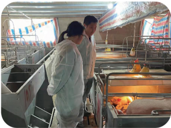
荔云场疫情期间韦场长和丘副场长视察工作