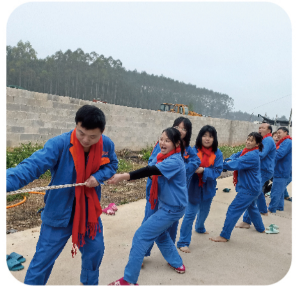
元宵节场内举办团建活动