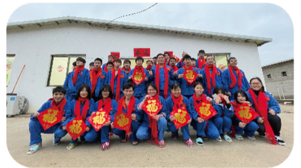
场内员工节日合影