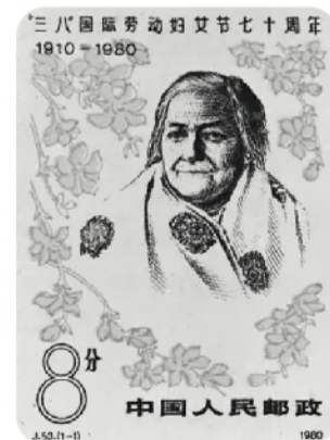
《“三八”国际劳动妇女节七十周年》邮票

20世纪初这一系列发生在欧洲和美洲的社会主义女权运动共同促成了“三八”国际妇女节的诞生。